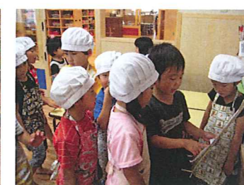
準備ができると献立表で確認をします。