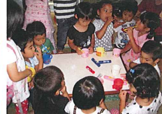
お部屋で歯みがき