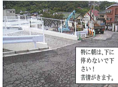
特に朝は、下に停めないで下さい! 苦情がきます。