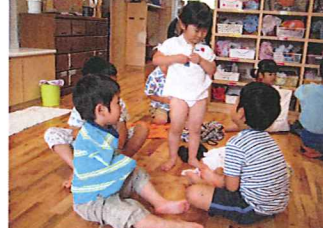
パジャマに着替えます。