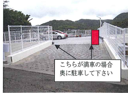
こちらが満車の場合奥に駐車して下さい