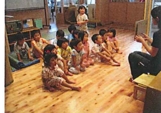
おほしましルームで絵本を読みます。