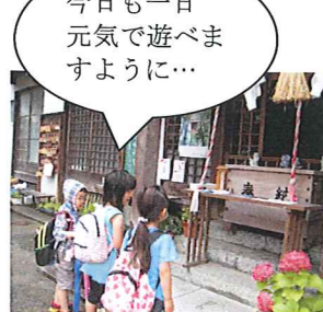
今日も一日元気で遊べますように…

春日神社遊歩道は、雨天時、滑りやすくなりますので、ご注意ください! 子どもたちは、とても上手で、雨の日はゆっくり踏みしめて歩いています。何事も経験だなあ…と感心しています。