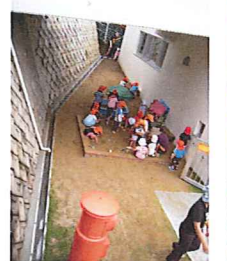
一緒に同じ遊具で遊び、おもやいの心を育みます。