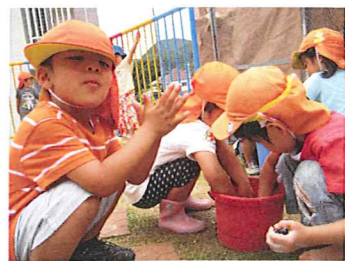
神社から拾ってきた実を洗ったら、泡になったよ! (お友達と活動していると、色々な発見があります。)