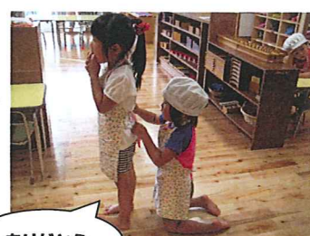
エフロンのリボン結びをしてくれました。