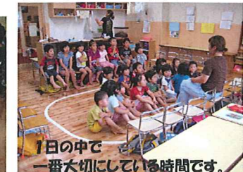
1日の中で一番大切にしている時間です。